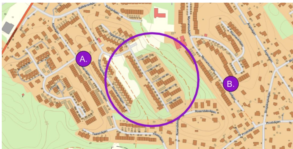
Milstensparken samt de två lekplatser som avvecklas, Aspvägen (A) och Myrmarksvägen (B).

Detaljprojektering av parken planeras att genomföras under hösten 2025. Byggnation bedöms kunna påbörjas hösten 2026 efter godkänt genomförandebeslut.